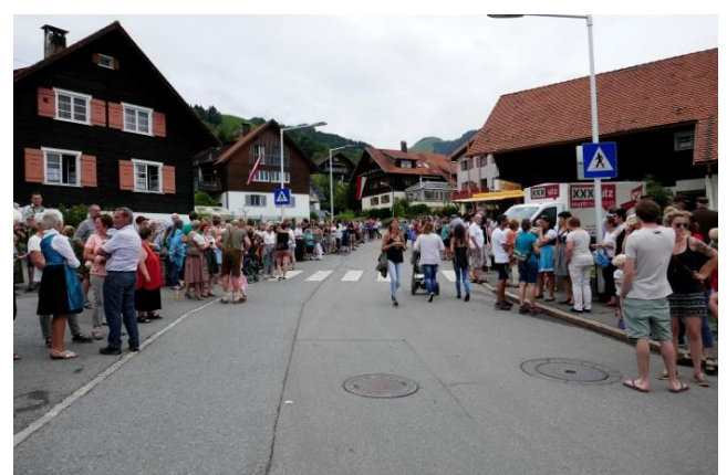
Bezirksfeuerwehrfest 2017