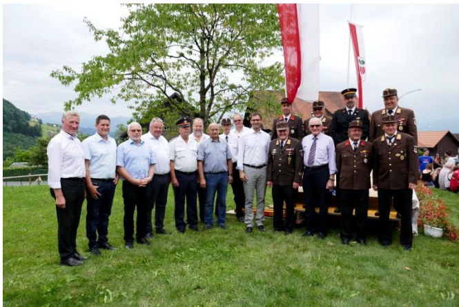
Bezirksfeuerwehrfest 2017